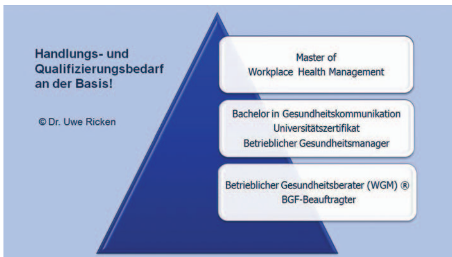
Abbildung 1: Erforderliches Know-how auf unterschiedlichen Managementebenen 3

Der Personenkreis der Mitarbeiter, der für die „Betriebliche Gesundheitsförderung für alle“ qualifiziert werden soll, umfasst z. B. Betriebsratsmitglieder, Fachkräfte für Arbeitssicherheit, Meister, Ersthelfer, Suchthelfer und viele andere. „Zunehmend lassen auch Betriebskrankenkassen Mitarbeiter als Betriebliche Gesundheitsberater (WGM) 66 ausbilden („Casemanagement“) 7 (Weikert, 2007).“